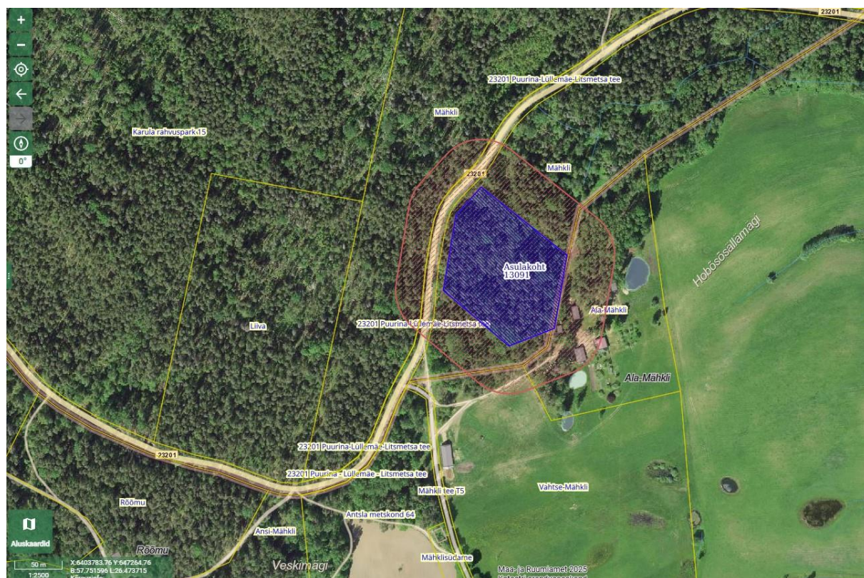
Lisa 1. Asulakoht reg-nr 13091 asukoht, ruumikuju ja kaitsevöönd Maa- ja Ruumiameti kultuurimälestiste kaardikihil seisuga 29.05.2025. (Alus: Maa- ja Ruumiameti geoportaali kultuurimälestiste kaardikiht)