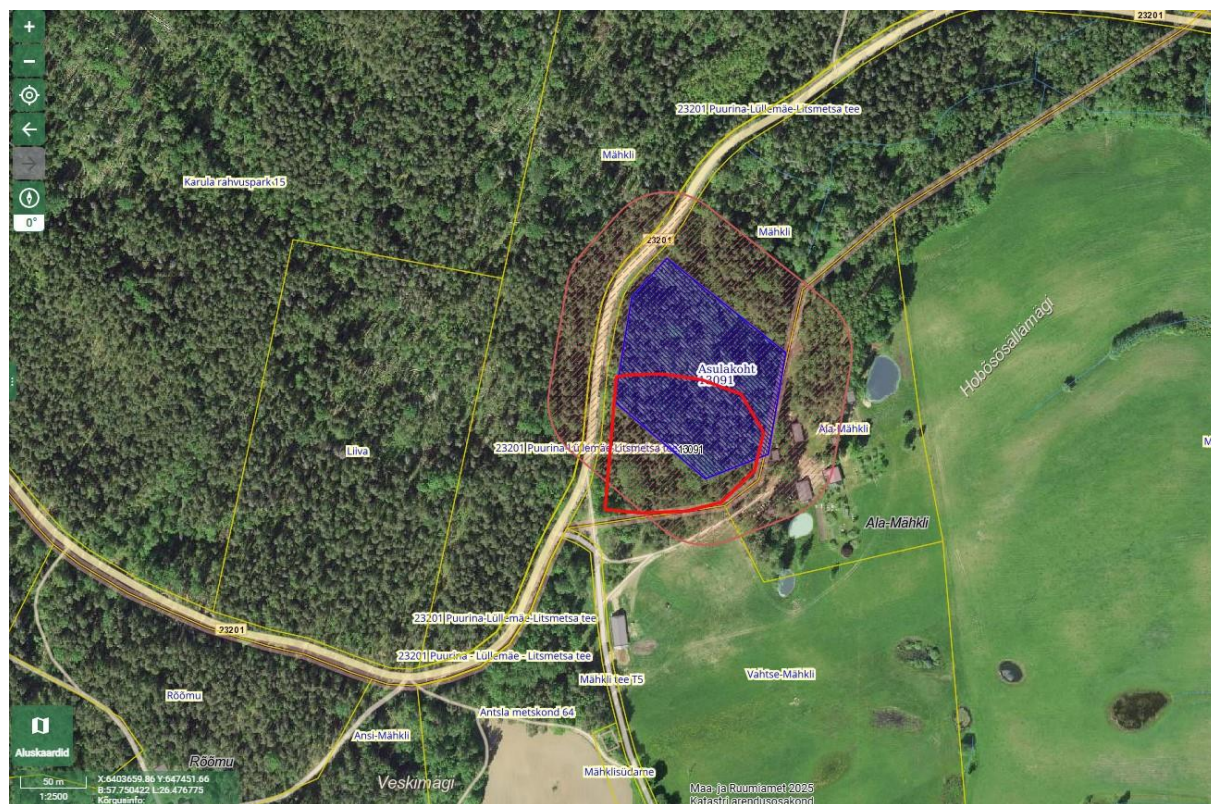
Lisa 2. Asulakoht reg-nr 13091 tegelik asukoht ja ruumikuju.